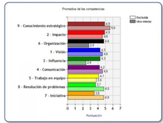
Ref. Informe cuestionario Thomas 2012

- COMPROMISO DIRECTIVO: Es fundamental el compromiso de la Dirección para clarificar los objetivos, movilizar la organización,