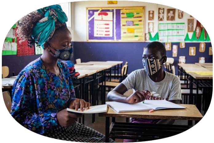
Fundación Encontro, consejo escolar (arriba), niños con maestra en Casa do Gaiato (abajo) ambas en Maputo y niña en la BiblioMóvel (abajo derecha)