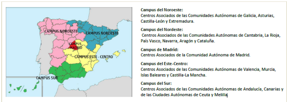
Mapa de la organización de Campus de la UNED

Para una correcta coordinación entre los distintos Centros Asociados que forman parte de un Campus se han definido una serie de figuras de referencia: