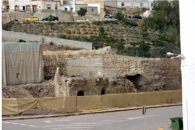
Antes y después de la actuación en la Muralla de la calle Rambla y su entorno.