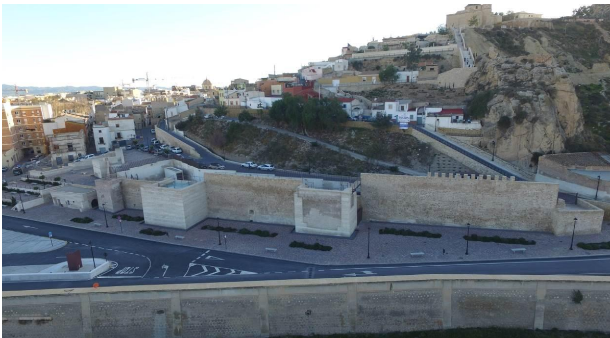
Imagen del conjunto de la zona finalizadas las actuaciones

Se han usado especies arbustivas de dos tipos: por un lado, arbustos aromáticos de sotobosque (jara, romero, tomillo y lavanda) y por otro lado, de flor abigarrada y vitalista (bugambillas, ibiscum, margaritas, rosales, etc). También se proyectan especies arbóreas: pino piñonero, olivos y cipreses, como soluciones típicas de laderas mediterráneas y gran raigambre cultural, y ocasionalmente árbol del amor para crear puntos de sombra fresca y contrapunto de decidido cromatismo. Todas las especies cuentan con sistema de riego por goteo. En los pies de los taludes se tiende un colector de drenaje, en el caso que la ladera vierta aguas contra muros o viviendas.