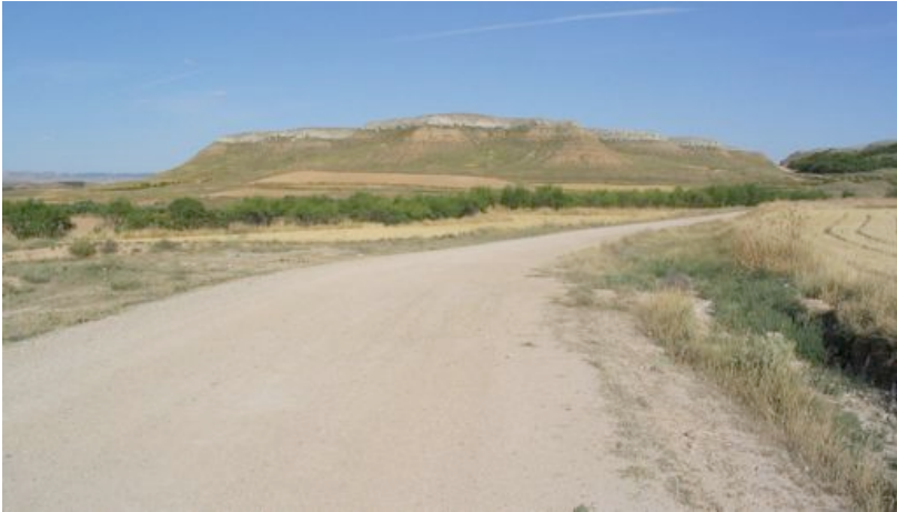
Imagen de la unidad en la zona de "Peñadil-Montecillo-Monterrey", antigua facería histórica.

Este tipo de paisaje se localiza únicamente al sur de la comarca, en el municipio de Ablitas, en la zona de Peñadil-El Montecillo-Monterrey, aunque tiene continuidad hacia la provincia de Zaragoza en la zona de Borja, de ahí que la unidad de paisaje se la denomine Mesas del Campo de Borja. Adaptándola a Navarra, podríamos llamar la unidad "Mesas de Ablitas".