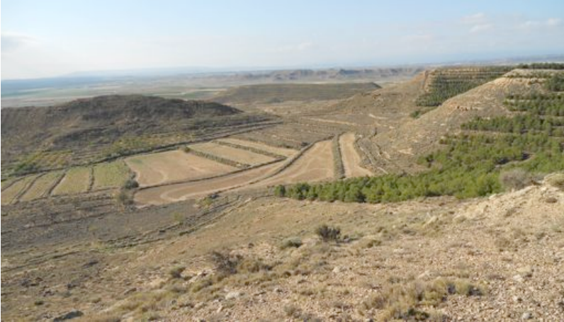
Suave inclinación y taludes de mesas y páramos en los Montes de Cierzo, en la unidad "Glacis de Tudela"

un paso entre las cuencas del Queiles y el Alhama que aprovecha la carretera NA-160.