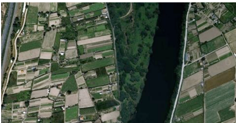
Contraste entre las pequeñas parcelas y huertos cultivados y un soto arbolado al N de Tudela.

Tienen importancia también los bosques de ribera (denominados sotos), que introducen especies caducifolias en una zona de marcado clima mediterráneo continental. Existen ejemplos muy valiosos y relativamente bien conservados en Tudela o Castejón de bosques de ribera integrados por tayadares, saucedas arbóreas, saucedas-choperas y alamedas. A lo largo del río Ebro, tras un largo proceso de privatizaciones de los primitivos sotos vecinales, pueden encontrarse aun hoy sotos comunales sin roturar, otros roturados y divididos en pequeñas suertes, pero de titularidad igualmente comunal, además de sotos particulares.