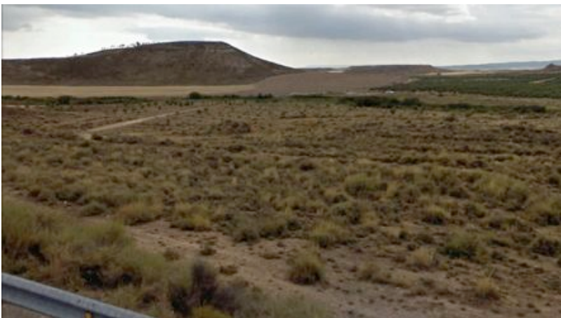
Una imagen de la unidad desde el límite provincial con La Rioja

El cultivo que más y mejor identifica el paisaje de la zona son los cultivos cerealísticos de secano y los viñedos. También destaca la presencia de olivos y almendros.