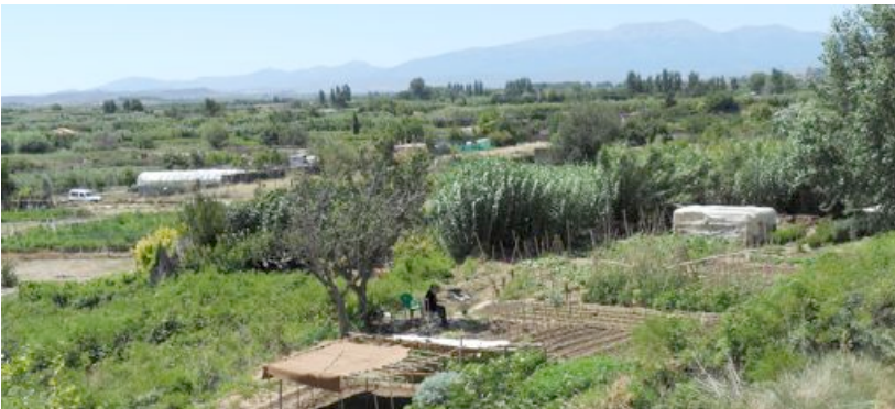
Pequeñas parcelas con huertos cultivados en la vega del Queiles, con el Moncayo de fondo

Son importantes en esta zona las viejas tramas hidráulicas y parcelarias, junto a las reparcelaciones actuales. Los canales de riego, como el de Lodosa, Tauste o el Imperial de Aragón, han dejado su impronta en el paisaje. La estructura parcelaria está atomizada, dividida en pequeñas parcelas.