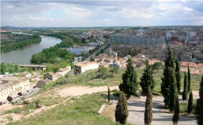
Vista general del río Ebro y Tudela desde el cerro de Santa Bárbara