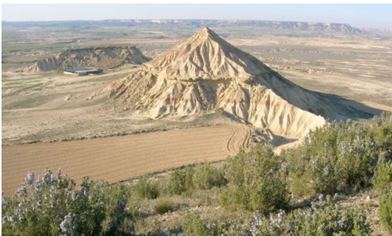
En primer término, cerro acarcavado en las Bardenas Reales,. Al fondo, relieves tabulares característicos de esta depresión erosiva.