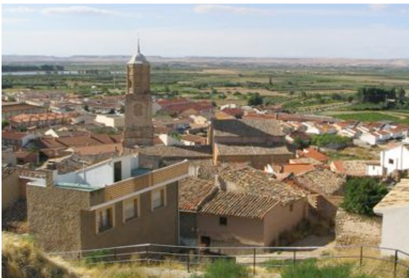
Vista del caserío de Ablitas con la vega del Queiles al fondo