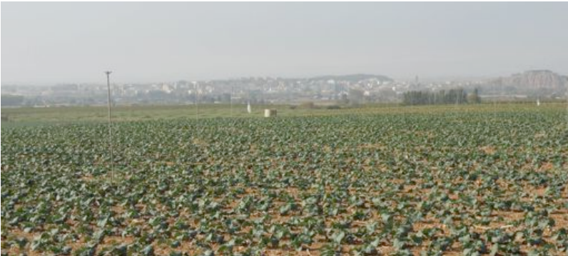
Cultivos de regadío con la silueta urbana de Tudela de fondo