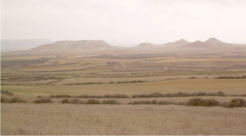
Panorámica de las Bardenas Reales, con las mesetas y cerros tabulares característicos de esta zona de glaciares

Pero la forma dominante del paisaje es la sucesión escalonada de glaciares, rampas de suave pendiente separadas por escarpes abruptos, y las terrazas fluviales y mesetas horizontales. Si bien es verdad que en la zona de Tudela, la inclinación muchas veces es apenas perceptible, dada la horizontalidad del paisaje. Las pendientes y los escalonamientos son suaves, y muestran la faz más genuina de la estepa ibérica. La incisión de los arroyos y barrancos ha modelado el relieve. En algunas ocasiones, la disolución de niveles superficiales de yeso ha generado concavidades u hoyas con lagunas y "saladas", muy características de la zona.