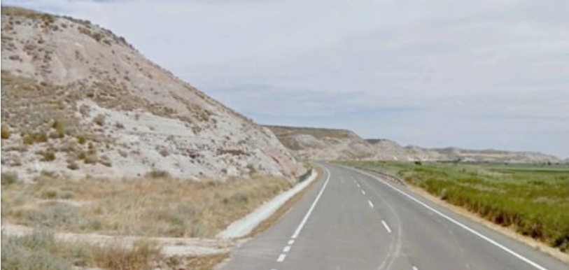
Contacto entre la vega del Ebro, a la derecha, y el glacis abarrancado de las Bardenas Reales, a la izquierda, cerca de Fustiñana.

Son importantes en esta zona las viejas tramas hidráulicas y parcelarias, junto a las reparcelaciones actuales. Los canales de riego, como el de Lodosa, Tauste o el Imperial de Aragón, han dejado su impronta en el paisaje. La estructura parcelaria está atomizada, dividida en pequeñas parcelas.