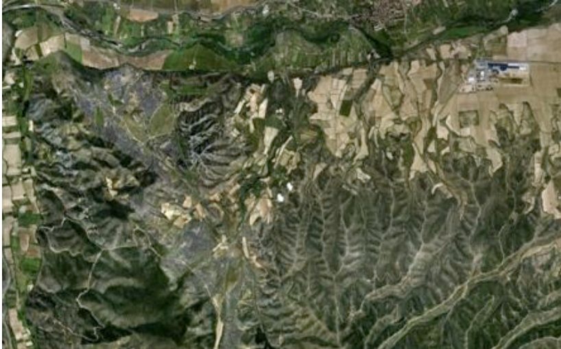
Contacto entre la unidad de paisaje "Glacis incididos a pie del Moncayo" y la vega del río Alhama, con el casco urbano de Fitero y el río Alhama en la parte superior de la imagen.

La base del relieve la forman los materiales sedimentarios oligocenos y miocenos de relleno de la fosa ibérica. El modelado está condicionado por el orden de los sedimentos, con predominio de conglomerados y areniscas en los márgenes de la cuenca (cerca del Sistema Ibérico), y de sedimentos de precipitación química, como los yesos y algunas calizas pontienses más al centro de la misma (Bardenas).