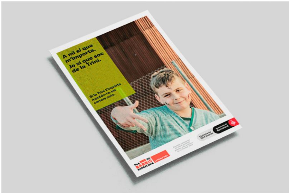
Resultado del taller en los colegios