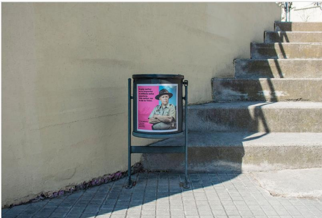
Cartel para la papelera