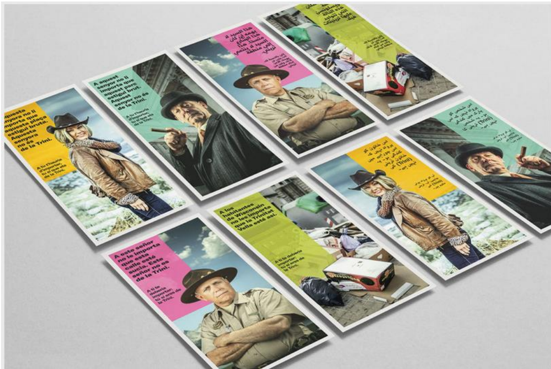
Carteles con los antagonistas de la campaña