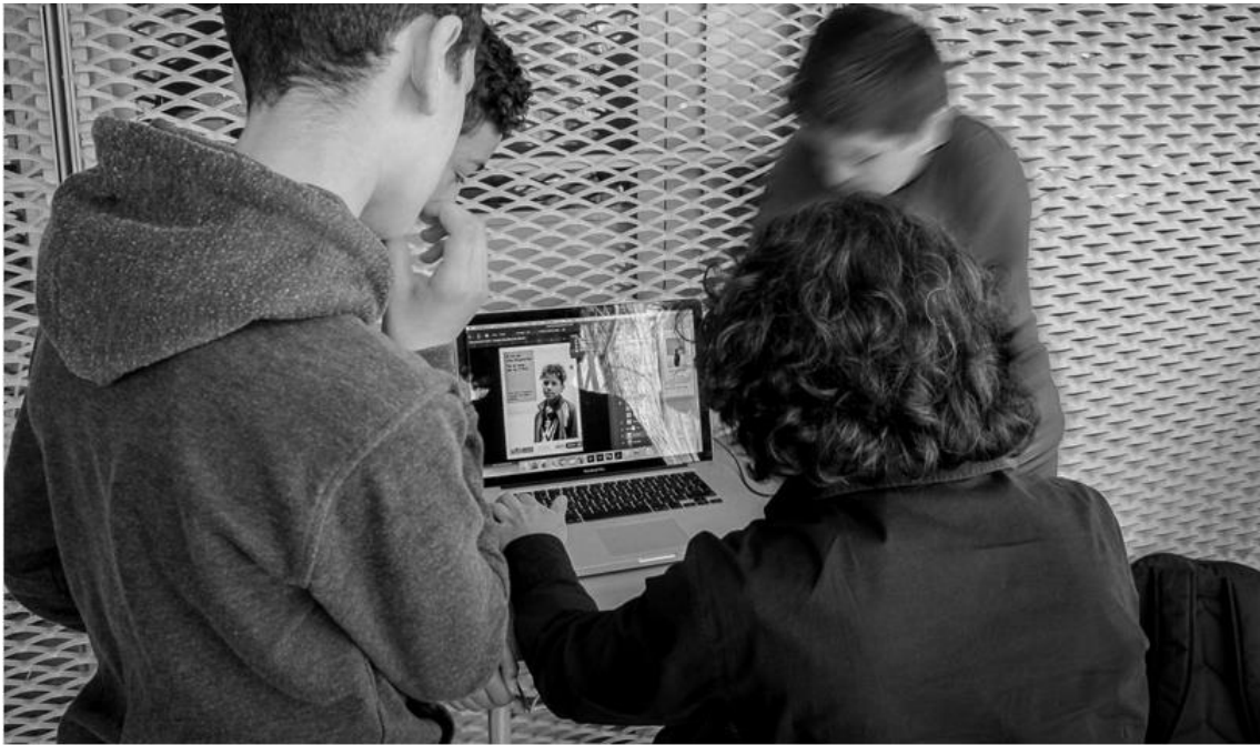
Making off del taller