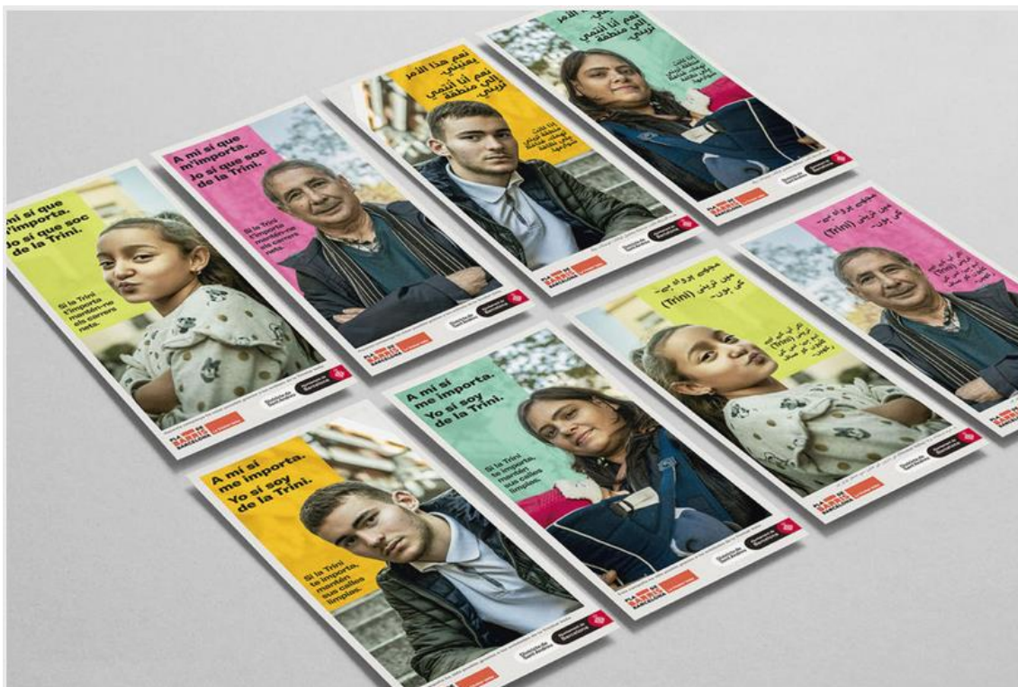
Carteles con vecinos de la Trini