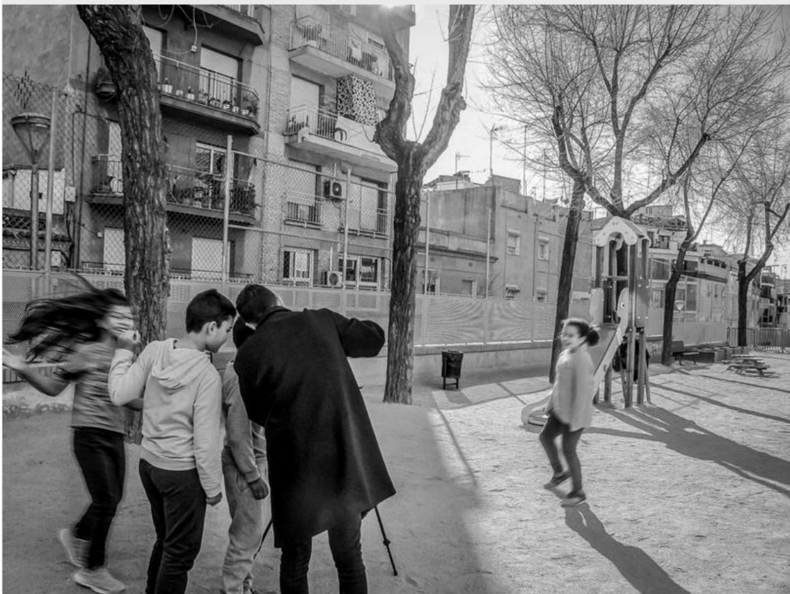
Making off del taller