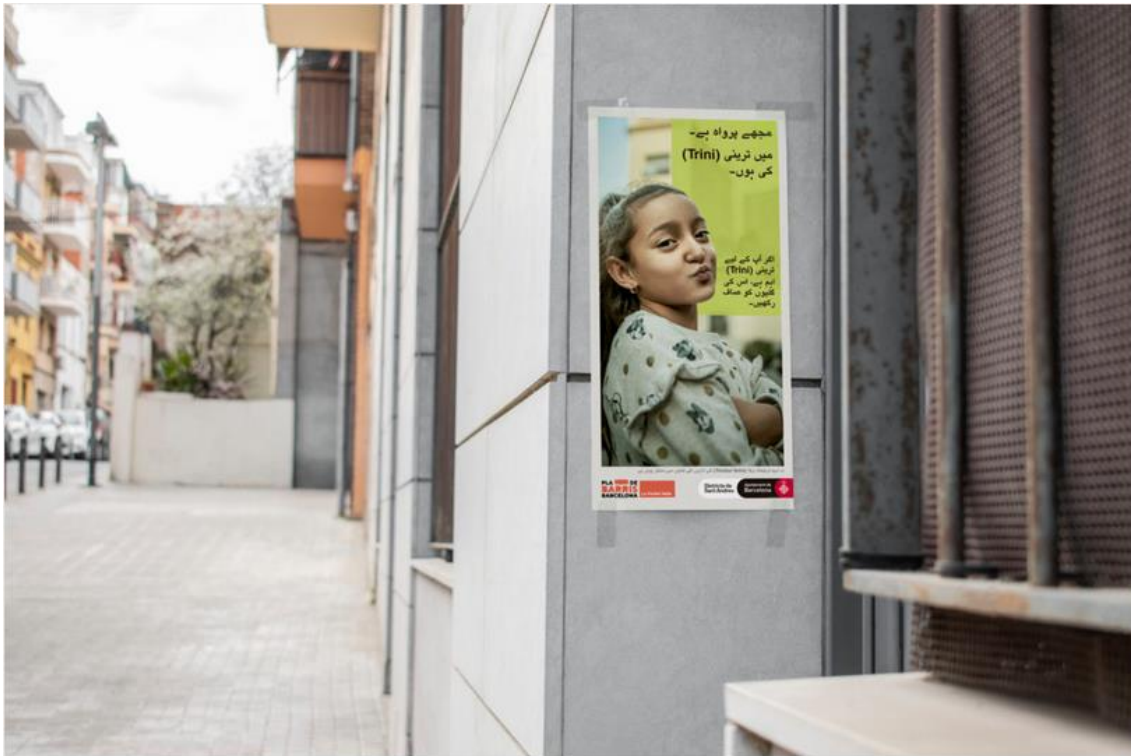
Cartel con vecina de la Trini