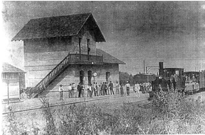
La antigua estación de Cascante con los trenes de vía estrecha