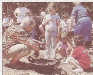
Els infants mostren interès i respecte per tot els que els ensenyen aquestes persones experimentades.