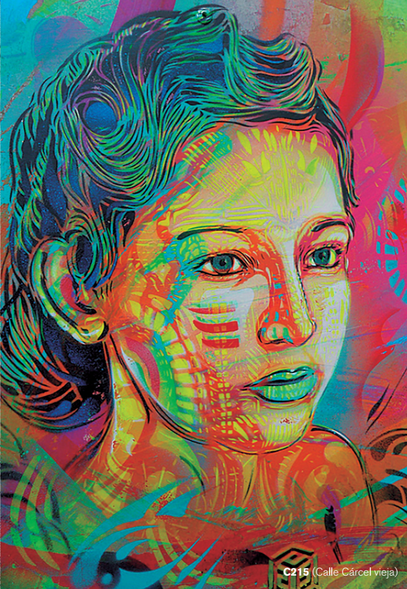
C215 (Calle Cárcel vieja)

Avant Garde Tudela es una muestra internacional de muralismo contemporáneo organizada por el Departamento de Cultura del Ayuntamiento de Tudela