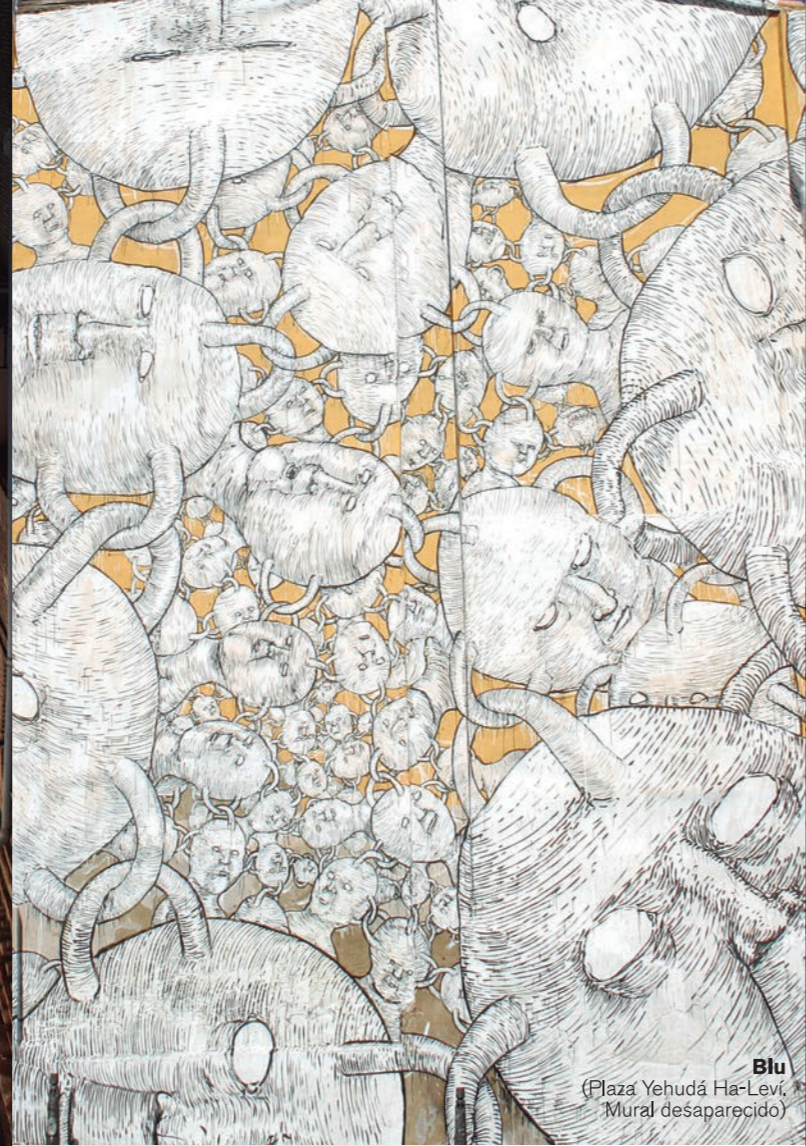
Blu (Plaza Yehudá Ha-Leví, Mural desaparecido)

Avant Garde Tudela Muestra Internacional de Muralismo Contemporáneo