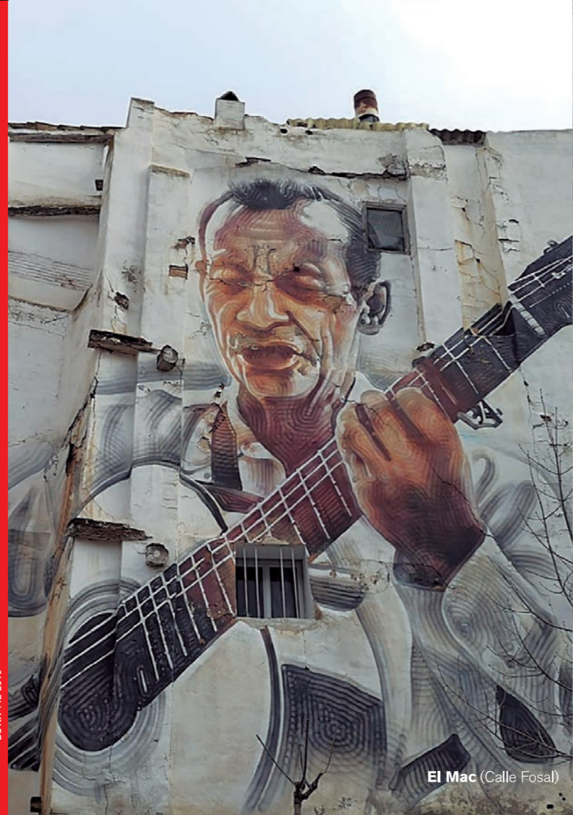
El Mac (Calle Fosal)